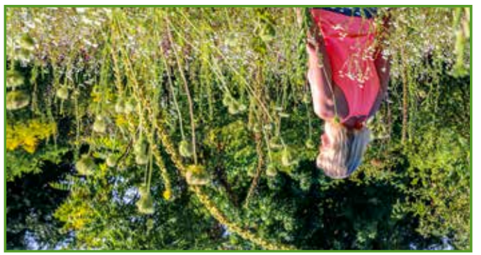
Wir wünschen viel Freude bei den Gartenbesuchen.

Um die verborgenen Gartenparadiese zur richtigen Zeit finden zu können, haben wir die Lage, die Kontaktdaten und eine Terminübersicht samt Öffnungszeiten in diesem Prospekt zusammengefasst. Bis zu drei Schlagwörter beschreiben den jeweiligen Garten und machen neugierig auf mehr. Auf der Internetseite www.private-gaerten.de sind aktuelle Termine und Informationen sowie ausführliche Beschreibungen der einzelnen Gärten hinterlegt. Bei Fragen stehen die Gartenbesitzerinnen und -besitzer gerne zur Verfügung, einige bieten auf Nachfrage auch individuelle Öffnungszeiten an. Wer Interesse an der Öffnung des eigenen Gartens hat, kann sich gerne bei uns melden.